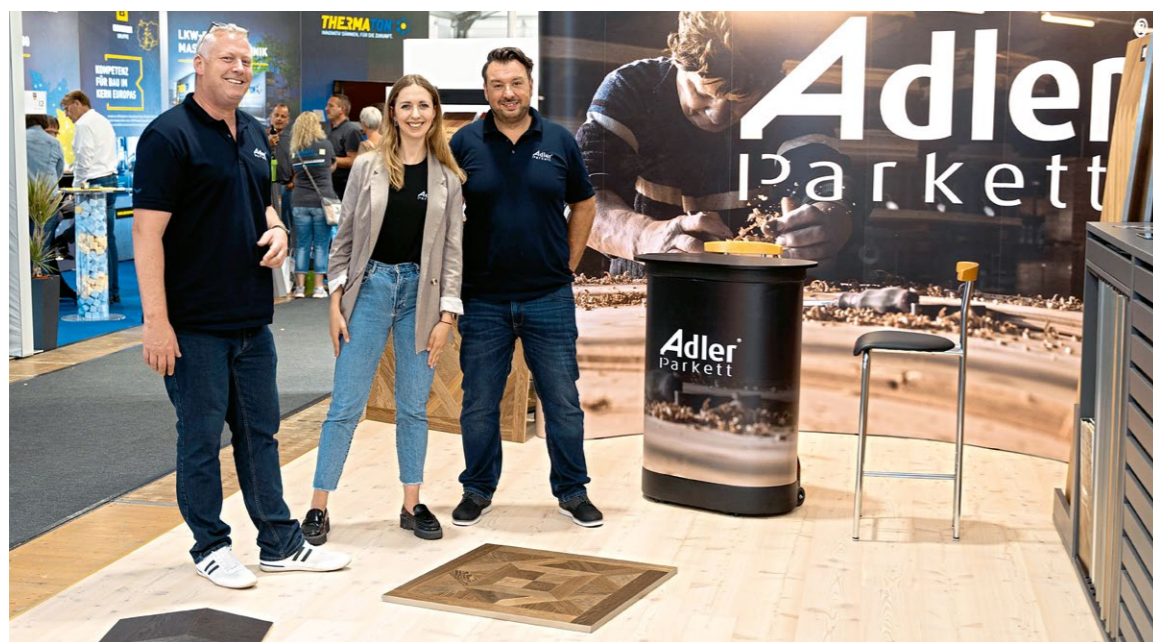
Namhafte Parkethersteller präsentierten auf der EPF aktuelle Trends.