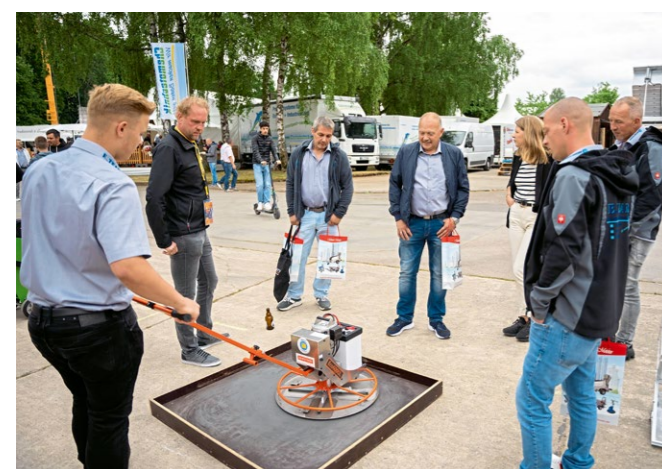
Ausprobieren und fachsimpeln. Auf dem Freigelände gab es dazu jede Menge Möglichkeiten.

Zum Rahmenprogramm der EPF zählte auch diesmal wieder ein begleitendes Vortragsprogramm mit Vorträgen unter anderem zur „Erstellung und Sanierung von Estrich und Fliesenböden“, der „Ausführung von barrierefreien Badezimmern“, der „Oberflächen-