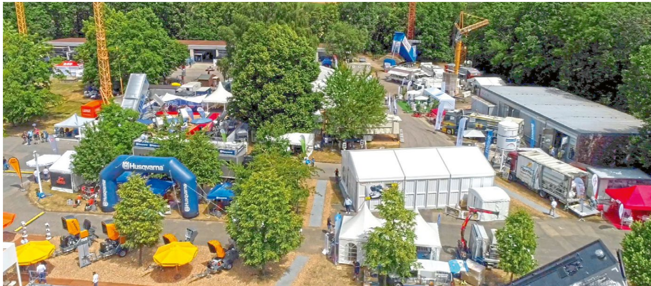
Auf dem Freigelände wurden auch in diesem Jahr wieder Estrich- und Bodenbearbeitungsmaschinen führender Anbieter präsentiert.