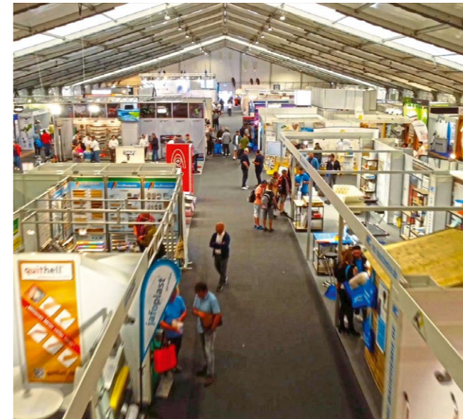
Rund 150 Aussteller präsentierten ihr Angebot unter anderem in zwei klimatisierten Zelten.

relanges „Estrichmekka“ geschuldet, dominierte auch in diesem Jahr das Angebot für Estrichleger und Fußbodenbauer. Die Parkettszene hätte mehr Teilnehmer verdient ebenso das Segment Fliese. Auch fehlte der eine oder andere Verlegewerkstoffhersteller. Unter dem Strich tat das der Attraktivität der Messe allerdings keinen Abbruch. Beeindruckend vertreten waren unter anderem die fünf marktführenden Anbieter für vollautomatische mobile Anlagen zur Estrichherstellung vor Ort, jene rollenden „Estrichfabriken“, die längst den Baustellenalltag verändert haben und das Herstellen und Einbringen von Estrichen oder Schüttungen vor Ort wirtschaftlich und in gleichbleibender Qualität ermöglichen. Bremat, BMS, GB Machines, Overmat und Putzmeister präsentierten ihre jeweiligen Lösungen, die zunehmend mit digitalen Features punkten. Der niederländische Anbieter Bremat stellte dabei erstmalig eine elektronische Version eines mobilen Mixsystems zur Estrichherstellung vor.